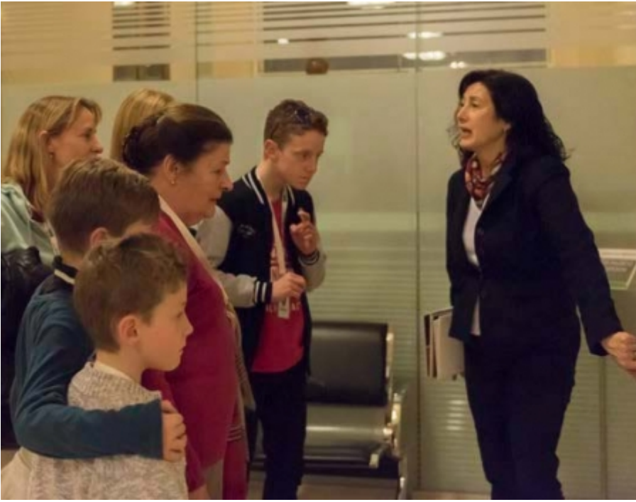
"Este tipo de construcción mecánica no se va a repetir en la historia"