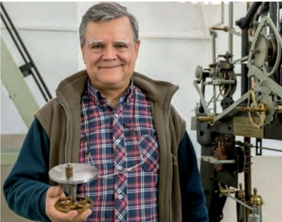
"Restaurando el patrimonio se rescata y devuelve la identidad a la ciudad"