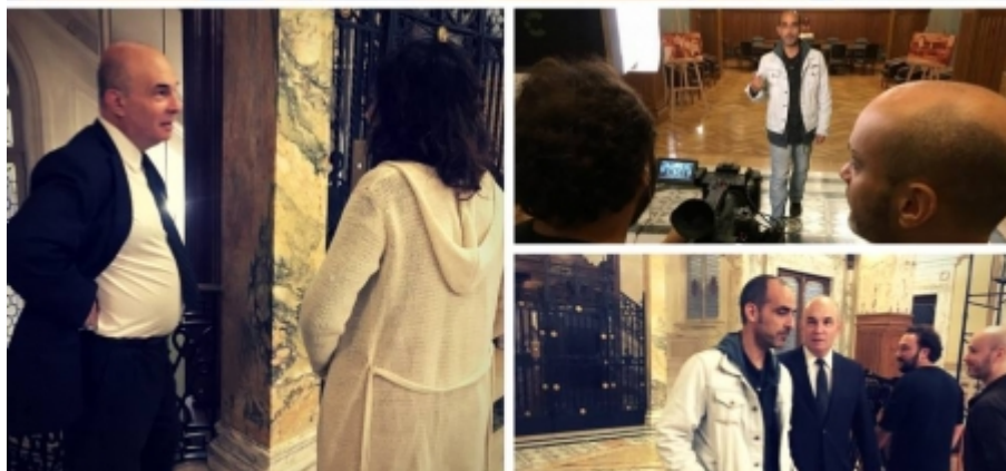
“En casa había un montón de cuadros, era como vivir en un pequeño museo”