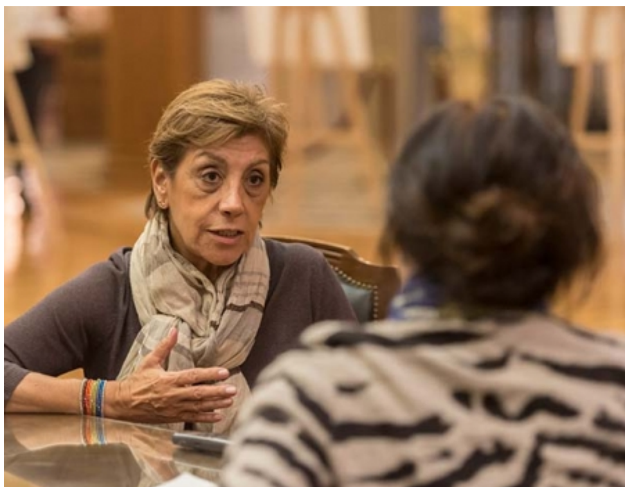
Visita de familiares del fundador del Instituto Biológico Argentino